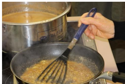
ペーストがおいしさの決め手