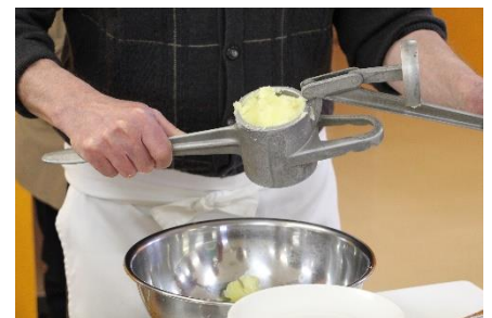
専用の器具でじゃがいもをマッシュしました

今回はスープに入れて食べましたが、生 pasta はフライパンでバターと炒めて食べてもおいしいとのことでした♪