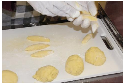
細長く伸ばしたら包丁でカットします