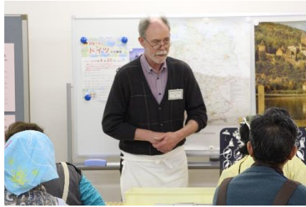
参加者からの質問にもお答えしました