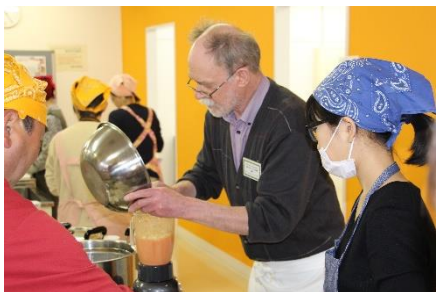
ミキサーでピューレ作り

開会の後はグループに分かれ、いよいよ調理開始です。一品目はレンズ豆のスープです。レンズ豆(和名:ヒラ豆)は西アジア原産の豆です。日本ではあまり馴染みがないレンズ豆ですが、市内のお店でも取り扱っており入手可能でした。スープや煮込み料理、インド料理、イタリア料理、フランス料理で使われることが多いようです。ポールさんによると、以前のレンズ豆と比べて、最近販売している豆は水で戻す時間が短くて済むとのことでした。