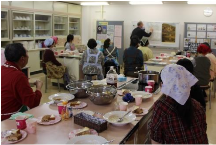
ポスターを見せながら説明

完成した二品の料理と一緒にドイツメーカーのハーブティーと、講師のお二人が店で販売しているケーキ（チーズケーキとホワイトィス）も一緒に頂きました。参加者からは「じゃがいもやにんじんなど馴染みのある材料で作れるところが自宅でも作りやすい」というコメントの他、「シンプルな材料なのにうまみがすごい」「体にやさしい味」「ケーキがおいしい」などの感想が多くあげられました。