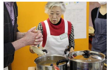
味を調べ完成間近!

レンズ豆、水、ミキサーでピューレにした野菜(にんじん、じゃがいも、にんにく)を煮込み、玉ねぎのペースト(みじん切りの玉ねぎ、バター、小麦粉の材料で作ったもの)を混ぜ合わせ、塩で味を調べて煮込めばスープの完成です!