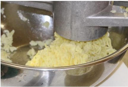
一瞬でじゃがいもが麺状に！