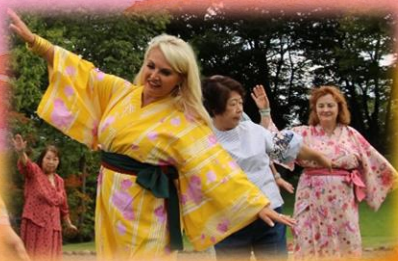
浴衣姿で踊りながら 地域の方々と交流♪