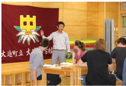
木工品のキーホルダー作り