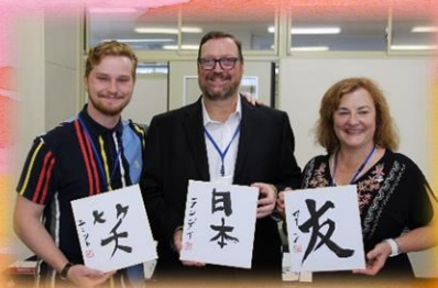
花巻東高校 習字作品を持って記念撮影