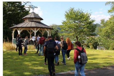
ベルンドルフの丘