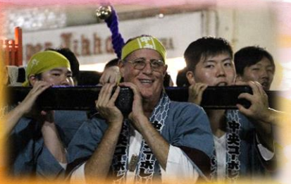
まつり2日目は神輿と山車へ チームに分かれて参加