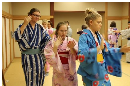
浴衣の着付け体験&大迫音頭を練習 STAR WING No.274