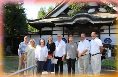
花巻まつり初日 雄山寺を訪問&見学