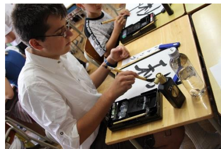
初めての習字体験