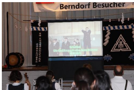
年間の学校の様子について鑑賞

＜学校訪問＞ 大迫高校、大迫中学校、大迫小学校を訪問しました。大迫中学校では、昨年ベルンドルフに引率した先生が、ギムナジウム生のために木工品を制作するクラスを担当して頂きました。嬉しいことに生徒達は全員が先生のことを覚えていました！約1年ぶりの再会となりました。