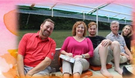
小雨でしたが屋根付きで 狛鼻溪の川下り

9月10日から15日にかけて、アメリカ合衆国ホットスプリングス市より8名の市民訪問団の皆さまをお迎えしました。滞在期間中は、花巻市内を中心に学校訪問や施設訪問、そして花巻まつりに参加しました。訪問時の様子を一部ご紹介させていただきます。