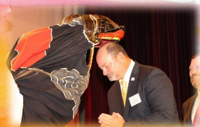
歓迎交流会での 初体験！