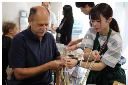
森のくいでトンボ玉製作