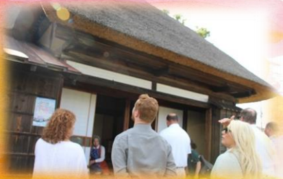
同心屋敷ではお茶っこを 頂きながら見学しました