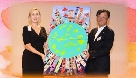
ホットスプリングス市から アート作品を贈呈頂きました