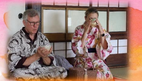
むらの家にて お茶や着付けを体験