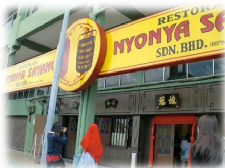
マラッカのニョニャ料理レストラン。