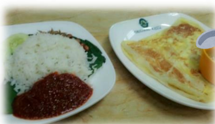
右：ロティ チャナイ。薄くばいばいたクレープ生地のようなもの。朝ごはんにも。 左：ナシレマ。ココナッツミルクで炊いたご飯に特製ソースをかけた料理。