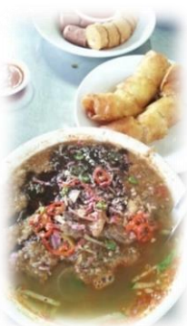
酸味の効いたラクサ

1つの国で様々な国の料理を堪能することができるのも魅力的！マレーシアを訪れる際はぜひ参考にしてください😊