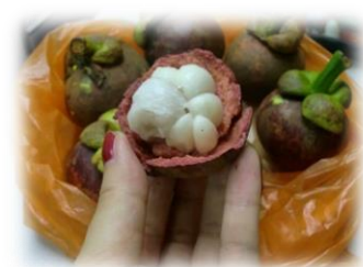
フレッシュなマンゴスチン