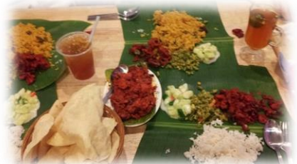
バナナリーフカレー