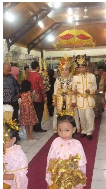
州であげた同僚の結婚式

現在（公財）花巻国際交流協会スタッフとして勤務 2010年～2012年までの2年間インドネシア共和国ゴロンタロ州ボアレモ県に栄養士隊員として派遣される。 首都ジャカルタよりボアレモ県まで直線距離で約2,300 km。ジャカルタから飛行機で（約3時間）→ミニバスに乗り換え（約3時間）→ボアレモ県に到着