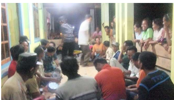
新郎の家。踊り自慢が次々と・・・。

った日本の曲です。2時間ほどでお開きになり、参加者は新郎新婦とその両親に握手して「おめでとう」と声をかけて帰ります。その後も大音量のカラオケが深夜まで鳴り響きます。おかげで行ったばかりの頃は不眠に悩まされました。新郎の家には近所の人が集まって、夜更けまで太鼓に合わせて踊って幸せを分かちあいます。