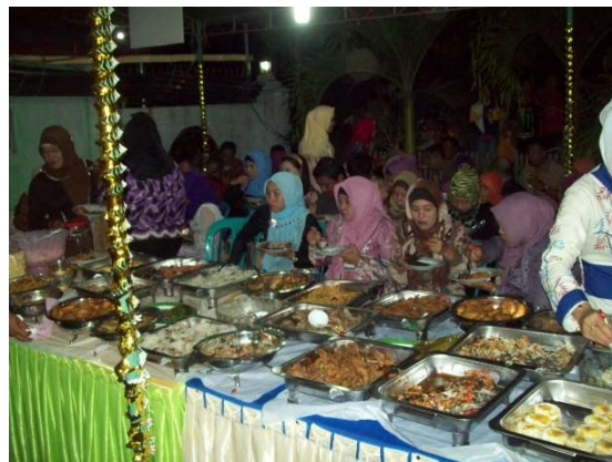
ビュッフェ形式。料理がなくなるとすぐおかわりが運ばれてくる。