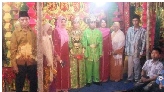
記念撮影。新郎新婦を真ん中にママと私。両サイドは両親。

日没後のイスラムのお祈りが終わると結婚式が始まります。式場の入り口でご祝儀を200円ほど（気持ち）箱に現金で入れ（ママのお供のときは私は支払わず、ママだけのお支払い）お土産（新郎新婦の名前が入った扇子かキーホルダー）をもらいます。好きな席に着くとカラオケ隊の爆音が結婚式を盛り上げます。