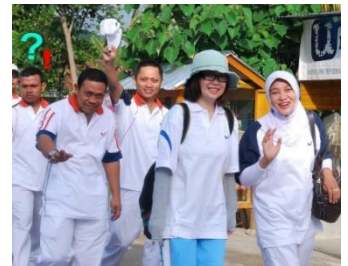
緊張で笑顔が固い私。

現在(公財)花巻国際交流協会スタッフとして勤務 2010年~2012年までの2年間インドネシア共和国ゴロンタロ州ボアレモ県に栄養士隊員として派遣される。 首都ジャカルタよりボアレモ県まで直線距離で約2,300km。ジャカルタから飛行機で(約3時間)→ミニバスに乗り換え(約3時間)→ボアレモ県に到着