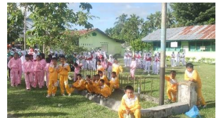
カラフルなジャージが可愛い小学生。