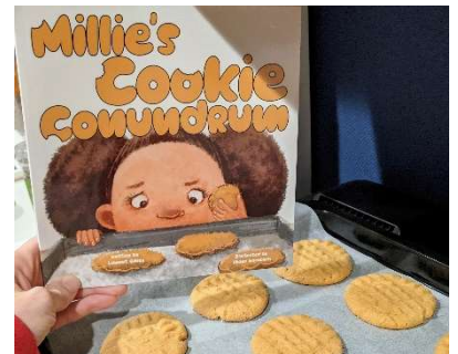
絵本にでてきたクッキーを作った

趣味と言えるほど熱心ではありませんが、お菓子作りが好きでマフィン・カップケーキ・クッキーを作ります。欧米のレシピを元