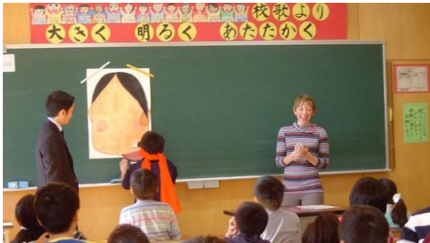
大学時代に岩手に留学したときの写真

にすることが多いので、ちょっとした実家の味を楽しむことが出来ます。お菓子作りの中でも卵・牛乳・バターなどを使わないヴィーガン料理のお菓子を作るのが特に面白いと思っています。科学実験の気分で作るのがとにかく楽しいです。