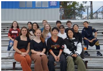
ホットスプリングス市

10月下旬から11月中旬にかけて、市内在住の中学2年生を国際姉妹都市等へ派遣します。派遣生の募集は学校を通じて行い、書類審査・面接を経て選考されます。出発前後には数回にわたって研修会を行い、帰国後は国際フェア内でのステージ発表、報告書の作成を行います。