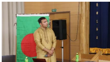
第2回「バングラデシュ」