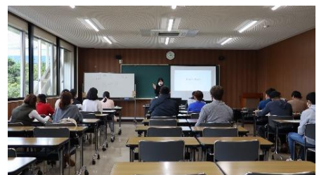
日本語スキルアップ講座